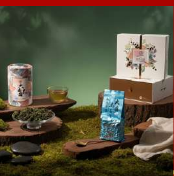
依然茶葉 攤位編號D317 至尊大禹嶺禮盒 現場價：NT$2,880元

※本手冊所有活動內容、優惠僅限1/23-26於世貿年貨大展使用 實際依現場公告為主,大會保有修改及解釋之權利。