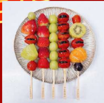
牛B葫蘆王 攤位編號D431 菓菓經典8入組 現場價：NT$940元