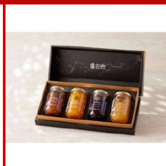
富士山美食物語 D824 日本季節低糖果醬禮盒(4入) 現場價：NT$800元