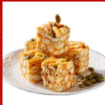
裕珍馨 攤位編號 D436 非油炸沙其瑪南瓜子(40入/袋) 現場價：NT$260元