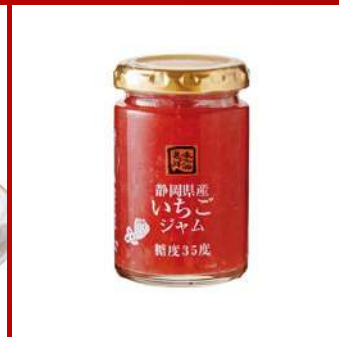
富士山美食物語 D824 靜岡縣產草莓果醬 原售價：NT$340元 現場價：NT$290元