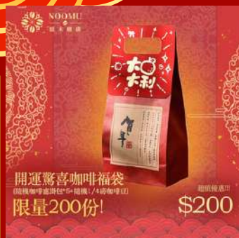
暖木咖啡 攤位編號C811 咖啡福袋組 現場價：NT$200元