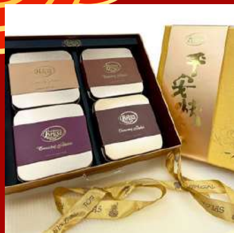
義大利BRUSA 編號 D921 尊榮金禮盒 現場價：NT$1,800元