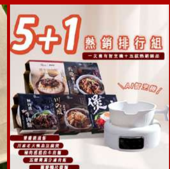
久蒂 攤位編號C816 Koodie5+1熱銷排行組 現場價：NT$2,100元