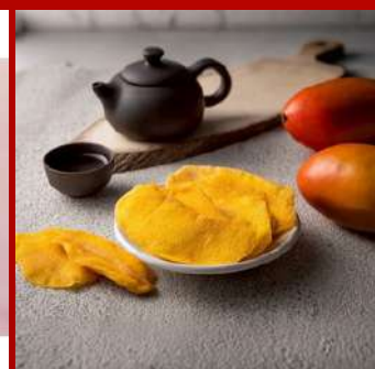
富村嚴選 攤位編號D314 keoCraft芒果乾國貨組*6包 原售價：NT$900元 現場價：NT$500元