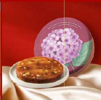
不二製果 攤位編號D434 豐年聚寶糕 現場價：NT$398元