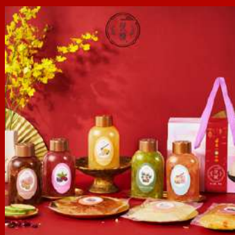
悅馥 攤位編號D335 白木耳飲綜合瓶裝6入組 現場價：NT$1,000元