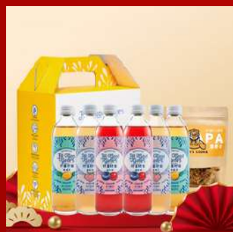
好菌好俊康普茶 攤位編號B1319 就是桃檸喜歡 新年禮盒 現場價：NT$888元