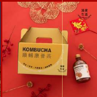
添菜生活 攤位編號B1325 天然發酵氣泡順暢康普茶 現場價：NT$600元