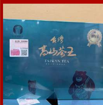
上青茶業 攤位編號D221 仁愛鄉農會比賽茶 現場價：NT$3,000元