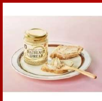
日商凜千 攤位編號D724 榛果醬 原售價：NT$350元 現場價：NT$250元