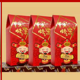
義大利BRUSA 編號 D921 平安快樂隨手盒 現場價：NT$199元