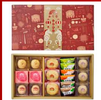
裕珍馨 攤位編號 D436 馨享-A禮盒 綜合18入 原售價：NT$549元 現場價：NT$756元