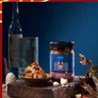
金拌麵 攤位編號C511 金門高粱嗆蟹 現場價：NT$600元