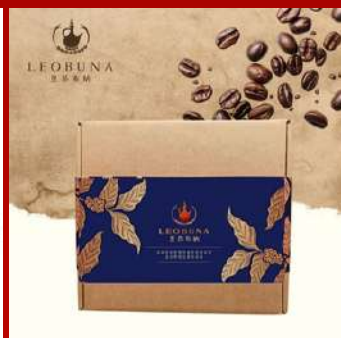
里昂布納 攤位編號D616 濾掛咖啡禮盒 現場價：NT$660元