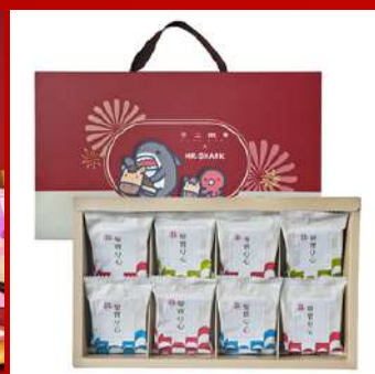
不二製果 攤位編號D434 鯊魚先生_8入聚寶Q心聯名禮盒 現場價：NT$398元