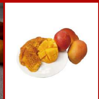
多利多國際食品 B1317 台灣芒果乾 現場價：NT$250元