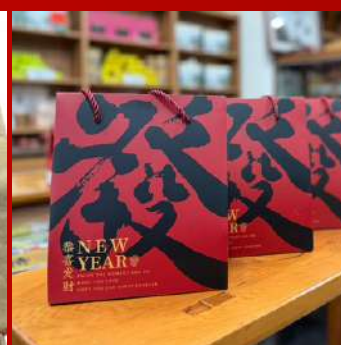
上青茶業 攤位編號D221 喝了就發茶包禮盒組18入 現場價：NT$200元