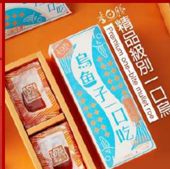
李日勝 攤位編號C711 野生烏魚子即食一口吃25入 現場價：NT$880元