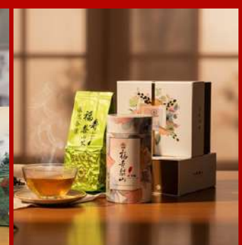
依然茶葉 攤位編號D317 福壽山千櫻園 禮盒 現場價：NT$1,880元