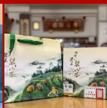
上青茶業 攤位編號D221 梨山烏龍比賽茶 現場價：NT$4,500元