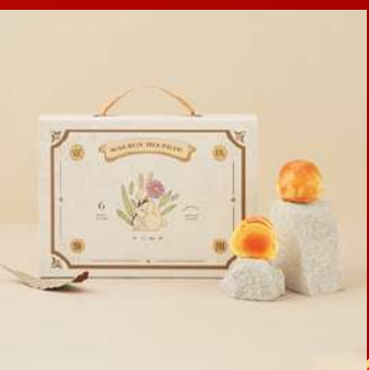
不二製果 攤位編號D434 6入黃金蛋黃酥 現場價：NT$520元

※本手冊所有活動內容、優惠僅限1/23-26於世貿年貨大展使用 實際依現場公告為主,大會保有修改及解釋之權利。