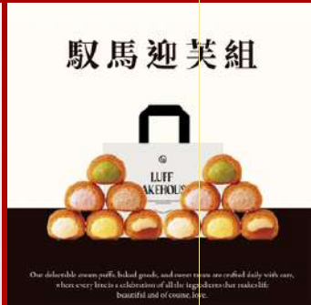
馭馬迎芙組 攤位編號D417 馭馬迎芙組 原售價：NT$549元 現場價：NT$470元