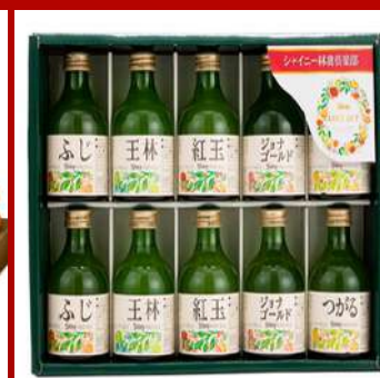
滬新貿易 攤位編號D720 青森蘋果汁10瓶裝禮盒180ml 現場價：NT$1,800元