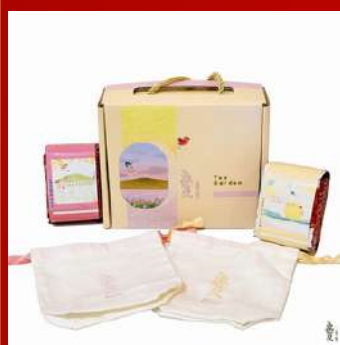
愛嬌姨茶園 攤位D219 「午後蜜果×晨露花香」禮盒組 現場價：NT$1,000元