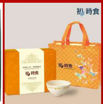
初時食 攤位編號C627 四季元氣湯精裝禮盒 現場價：NT$2,088元