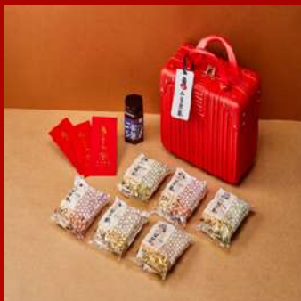
金拌麵 攤位編號C511 行禮鄉禮盒 現場價：NT$990元