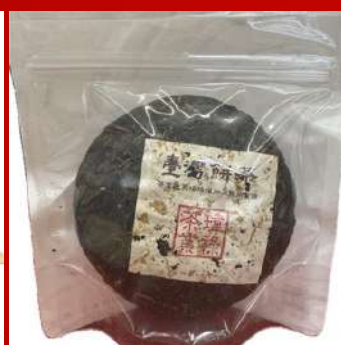
瑋祿茶業 攤位編號D331 梨山茶餅 現場價：NT$1,500元