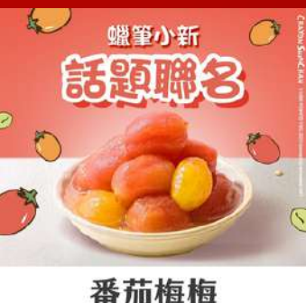
富協發行泡菜 C424 協發行泡菜 原售價：NT$300元 現場價：NT$250元

※本手冊所有活動內容、優惠僅限1/23-26於世貿年貨大展使用 實際依現場公告為主,大會保有修改及解釋之權利。