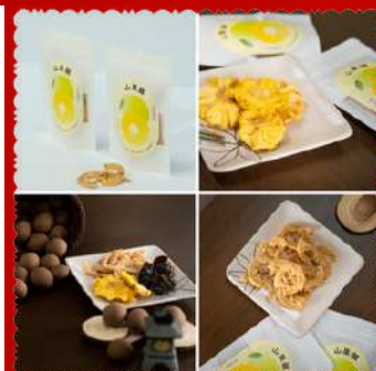
食山樂章 攤位編號B1331 山果韻 原售價：NT$80元 現場價：NT$60元