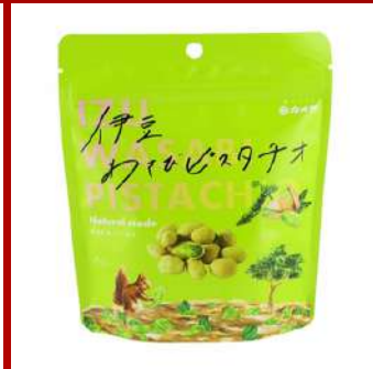
富士山美食物語 D824 KAMEYA伊豆山葵開心果 原售價：NT$320元 現場價：NT$300元