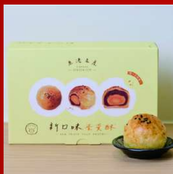
新口味食品行 編號 C416 新口味蛋黃酥 現場價：NT$350元