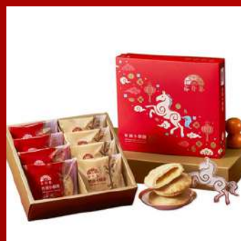
裕珍馨 攤位編號 D436 奶油小酥餅 8入禮盒 現場價：NT$399元