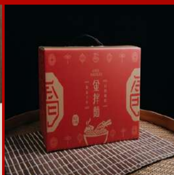
金拌麵 攤位編號C511 綜合九入禮盒 現場價：NT$399元