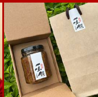
豐隆 攤位編號D617 一味饌干貝醬 現場價：NT$480元