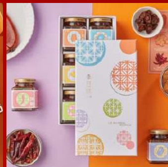
李日勝 攤位編號C711 頂級XO干貝醬 (6入/禮盒) 現場價：NT$1,540元