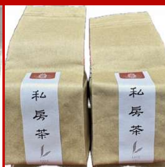
瑋祿茶業 攤位編號D331 凍頂私房茶 現場價：NT$3,600元