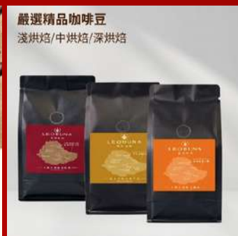
里昂布納 攤位編號D616 嚴選精品咖啡豆_淺中深烘焙 現場價：NT$300元