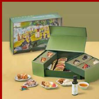
不二製果 攤位編號D434 流光綠映禮盒 現場價：NT$1,388元