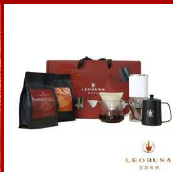
里昂布納 攤位編號D616 精品手沖咖啡大禮盒 現場價：NT$1,480元