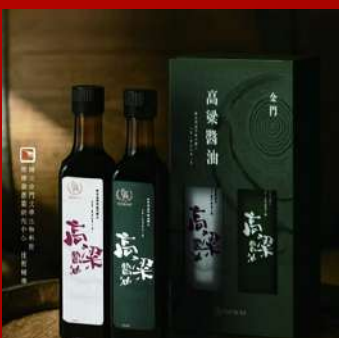
金高高粱醬油 攤位C861 金高高粱醬油 現場價：NT$299元

※本手冊所有活動內容、優惠僅限1/23-26於世貿年貨大展使用 實際依現場公告為主,大會保有修改及解釋之權利。