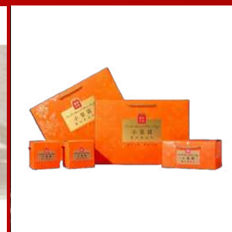
糧陳詰食 攤位編號C858 小梨窩六入經典禮盒 現場價：NT$1,288元