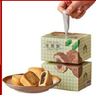
裕珍馨 攤位編號D436 桂圓酥 6入(盒) 現場價：NT$190元