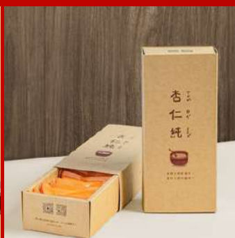
簡甜食品行 攤位編號D621 杏仁純5盒組 現場價：NT$2,000元